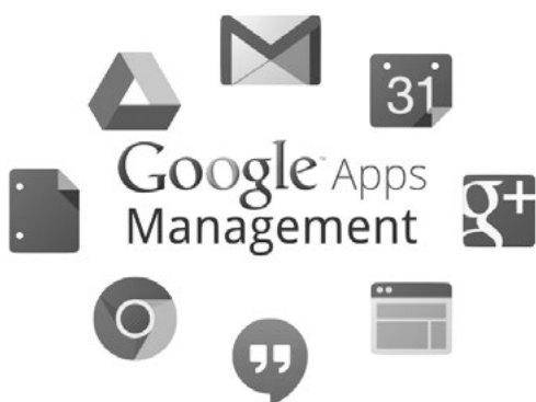
Rysunek 1. Usługi Google