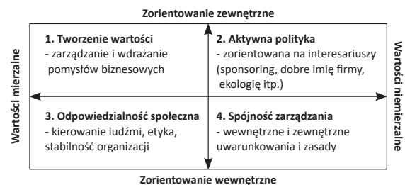
Rysunek 2. Cztery aspekty etycznego funkcjonowania organizacji