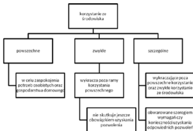
Rysunek 1. Schemat korzystania ze środowiska